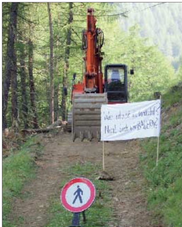
„Wer erhaltet die Landschaft? Nicht doch wir Bauern?“. Zusatz der Naturschützer zum Text auf dem Transparent: Mit dem Bagger? (Dickeralm 2004)