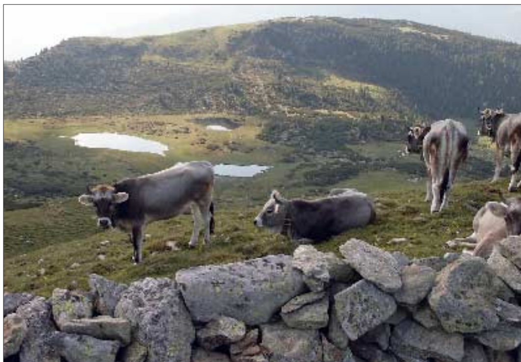
Im Hintergrund ganz links das „Gschwenter-Jöchl“, über das die Straße von Reinswald herführen soll