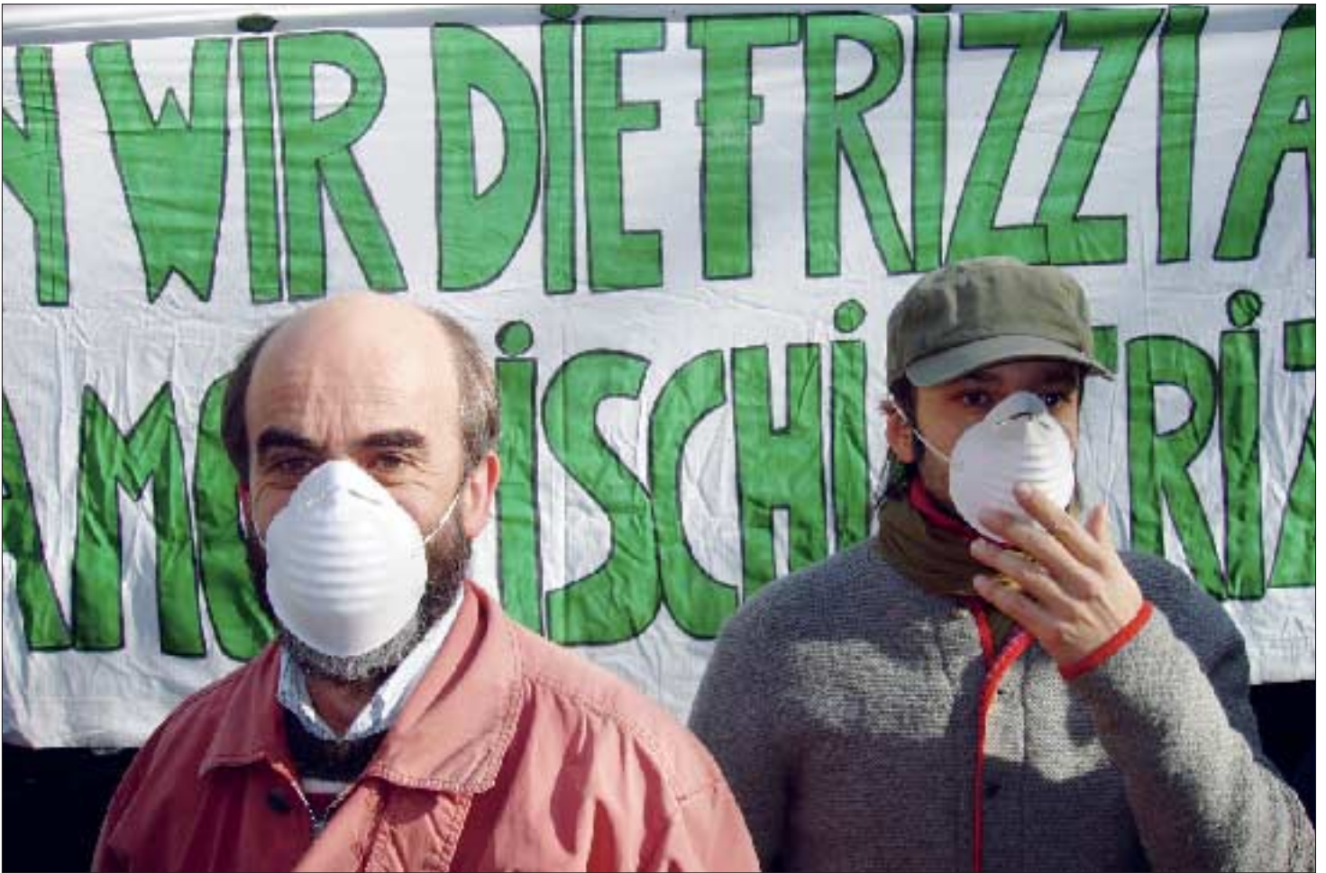
Die Luftverschmutzung ist heute eine andere, zum Teil gefährlichere als die vor dreißig Jahren. Eine Verbesserung der Luftsituation könnte nur durch einschneidende Veränderungen in unserem Verhalten erreicht werden.

ten in einem atemberaubenden Tempo, um die Verarmung unserer Natur, um das Krankmachende unseres Lebensstils. Wir schauen uns das Gruselszenario Zukunft, abwechselnd mit realem Krieg und realem Hunger, allabendlich und interessiert im Fernsehprogramm an, wissen Kyoto-Protokolle zu zitieren, lesen Geo-Reportagen über aussterbende Tierarten – aber wir tun wenig, wenig, um den Rest unserer Überlebenschancen zu wahren. Ein bisschen Panik nach dem Rindfleischskandal, zwei Monate entrüstete Enthaltensamkeit, dann darf die biochemisch-genetische Tierfoltermaschine namens Großmaststall wieder anlaufen. Und wir essen weiter unser täglich' Gift. Und auch da gibt's die vielen kleinen Rücksichten und die großen