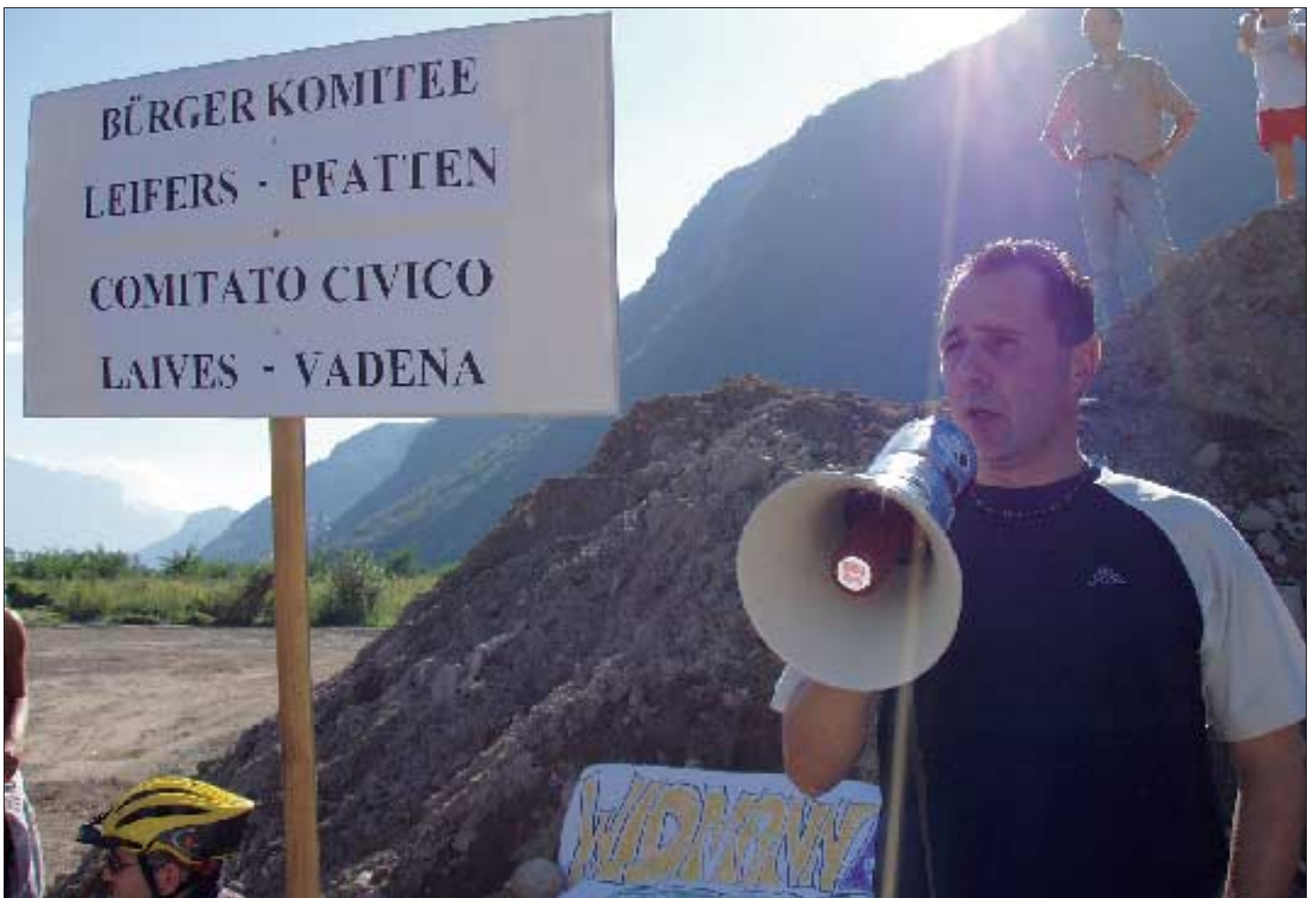
Ob mit oder ohne Megafon – die Landesregierung scheint die Anliegen der Bürgerinnen und Bürger nicht wahrzunehmen (Frizzi Au 2005)