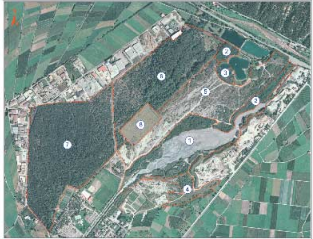
(1) Flussbett und Ufervegetation, (2) Auwald, (3) Teich, (4) Ruderalfläche, (5) Trockenlabn, (6) Laubmischwald, (7) Rotföhrenwald, (8) Lärchensamenplantage.

Ursprünglich umfasste das Schwemmgelände des Suldenbaches zwischen Prad und Spondinig eine riesige Fläche. Besonders in den letzten Jahrzehnten schrumpfte dieses auf ein bedenkliches Minimum zusammen, nachdem verschiedene Infrastrukturen dort angesiedelt worden. Auch heute sehen einige die Prader Sand als billigen Selbstbedienungsladen, als unnützes Brachland, das man unbedingt wirtschaftlich nutzen müsse. Und dies, obwohl nationale und internationale Fachstudien die große Bedeutung der Prader Sand für den Artenschutz belegen. Deshalb hatte der Nationalparkrat beschlossen, dass im Zuge der Neuabgrenzung des Nationalparks Stilfser Joch die ökologisch wertvollen Lebensräume, wie die Prader Sand u. a., als Landesbiotope ausgewiesen werden sollen. Laut IBA-Gutachten (important bird area) von Dr. Leo Unterholzner sollte die Prader Sand als Biotop bzw.