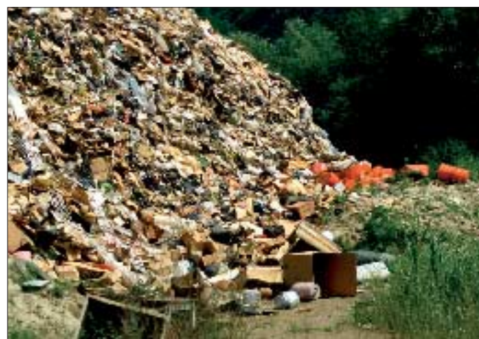
Fast zwei Jahrzehnte lang wurde im Delta der anfallende Müll aus dem Burggrafenamt abgelagert, wobei teilweise sogar Baggerteiche damit aufgefüllt worden sind. Die Mülldeponien, inzwischen zwar abgedeckt und begrünt, liegen heute noch als Altlasten im Grundwasserspiegel der Falschauerermündung.

Das Amt für Wildbachverbauung hat begonnen, die Konsolidierungssperren teilweise niedriger zu errichten und Fischtreppen zu bauen, so dass in Zukunft – auch dank der inzwischen garantierten Mindestwasseremenge von 500 l / sec – eine ungehinderte Fischwanderung stattfinden kann. Diese Maßnahme ist sehr begrüßenswert und wird sich auf den Fischbestand und auf die Gewässerfauna insgesamt sehr positiv auswirken. Diese Arbeiten werden im Laufe der nächsten Jahre weitergeführt.