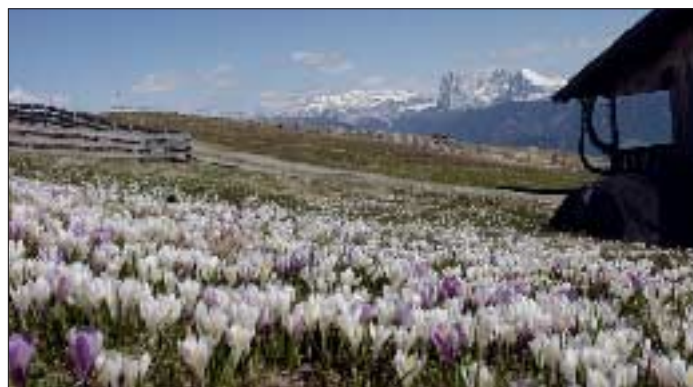
Krokusblüte auf der Villanderer Alm