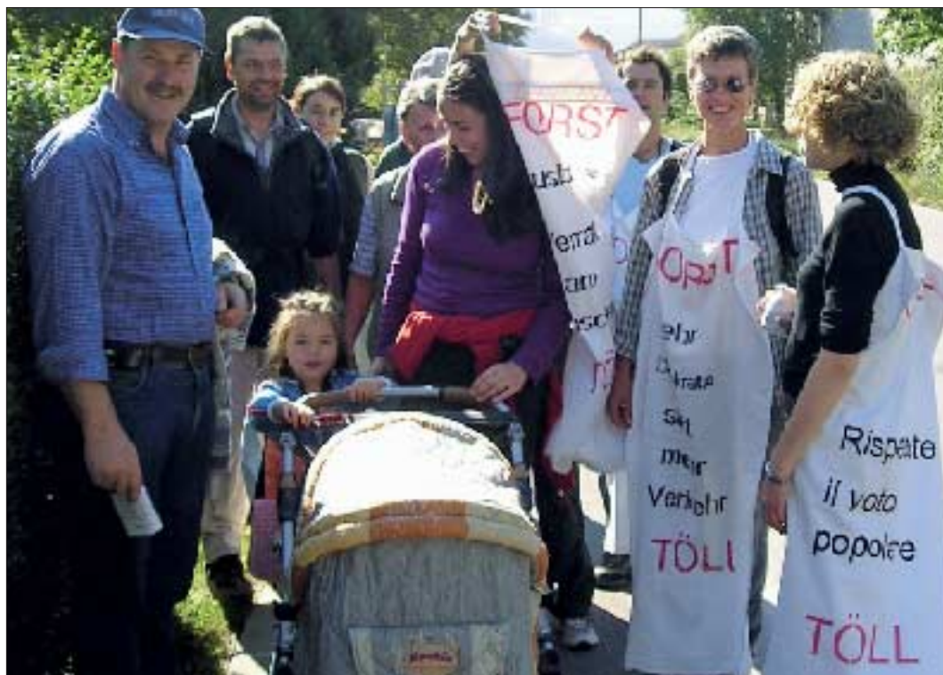
Nicht zufällig befinden sich Frauen bzw. Mütter unter den Protestierenden. Sie wissen, welche Umwelt ihren Kindern gut tut

Der Ausbau des Straßenstücks Forst-Töll war in den vergangenen zwei Jahren wiederholt Anlass für Diskussionen. (Siehe auch Naturschutzblatt 4/2004). Im vergangenen Jahr unterschrieben 5300 Personen gegen den Ausbau. Im Juli 2005 gab es nochmals die Mög-